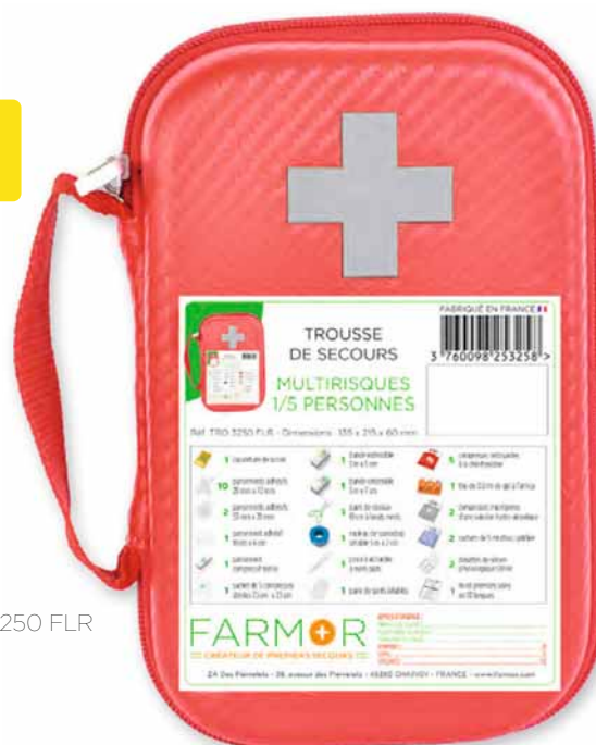
TRO 3250 FLR