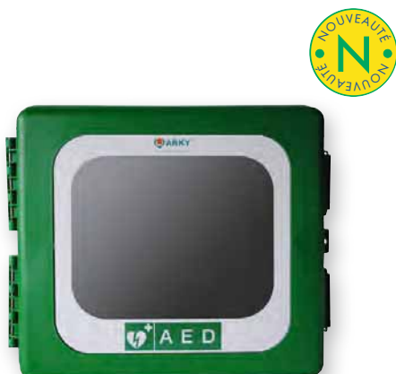
ARM 1200 XT