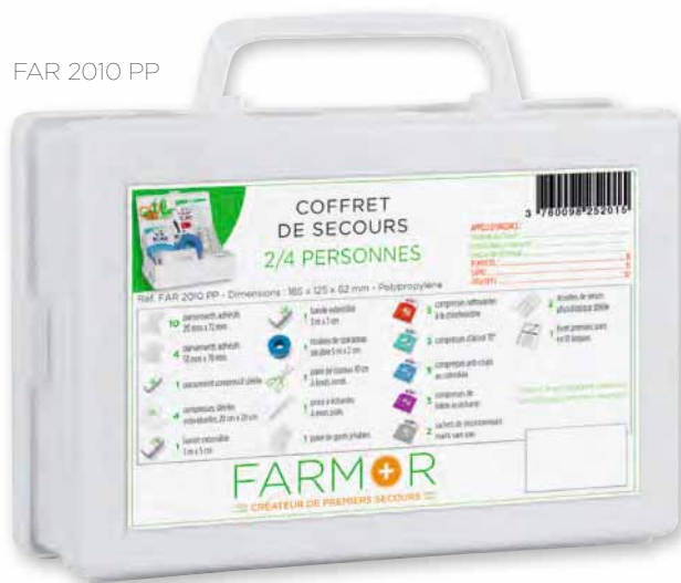
FAR 2010 PP

Ce coffret est disponible en box comptoir de 16 pièces Réf : BOX 2010 BP