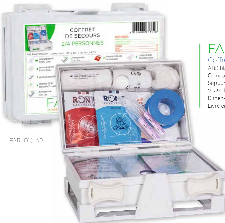
FAR 1010 AP