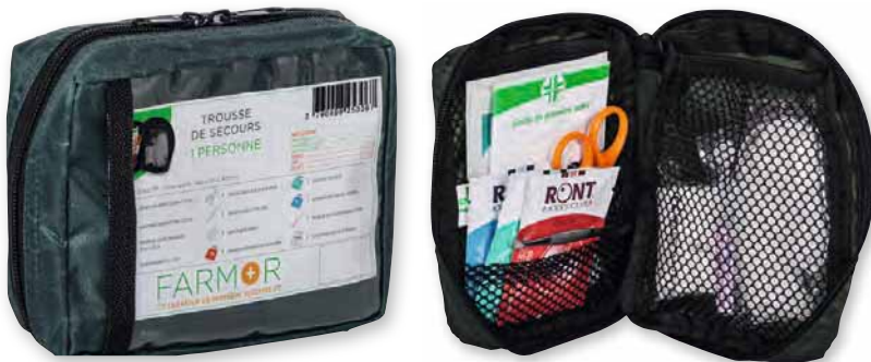
MIN 3060 TP