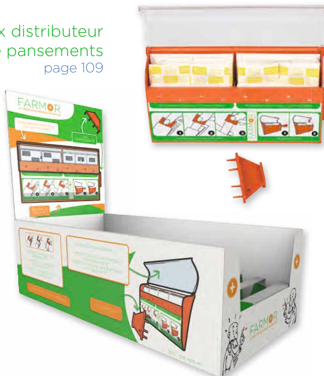
Box distributeur de pansements page 109