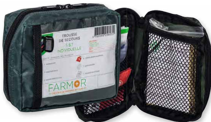
TRO 8033 TP