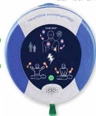
DEF 1007 EA

Défibrillateur de formation, référence DEF 1005 FO, disponible sur demande