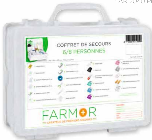
FAR 2040 PP

Ce coffret est disponible en box comptoir de 6 pièces Réf : BOX 2040 BP