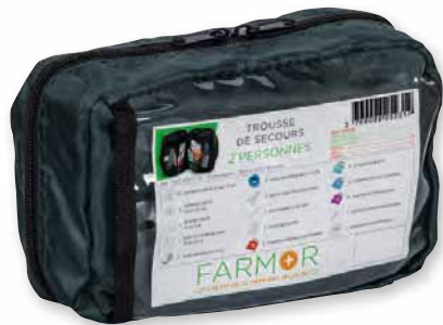
TRO 2070 TP