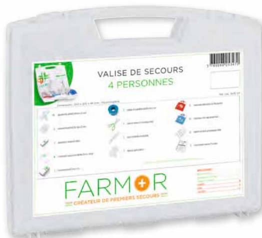
VAL 3475 SP