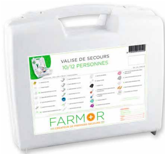
VAL 2050 PP