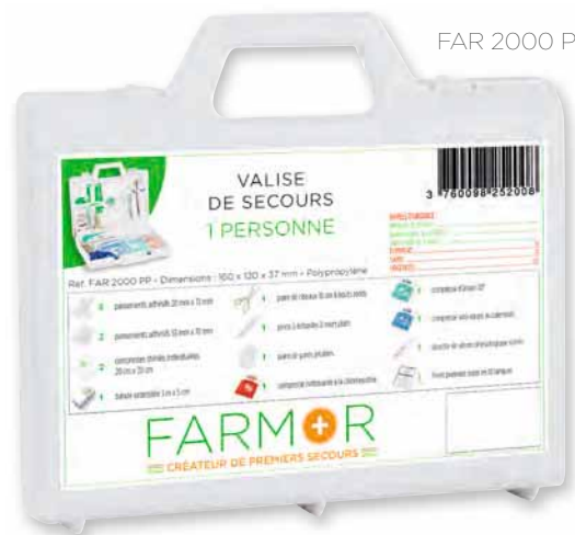
FAR 2000 PP