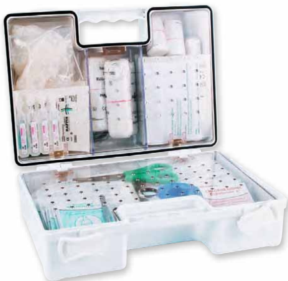
FAR 1040 AP