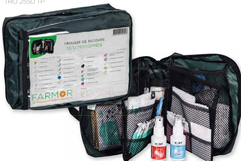
TRO 2550 TP