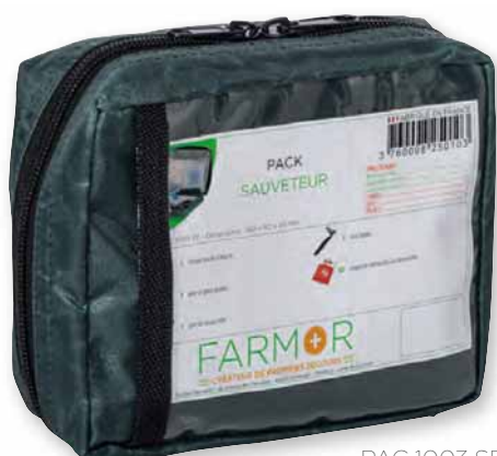
PAC 1003 SE