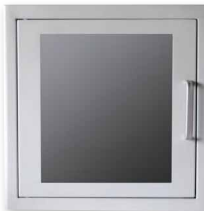
ARM 1006 DE