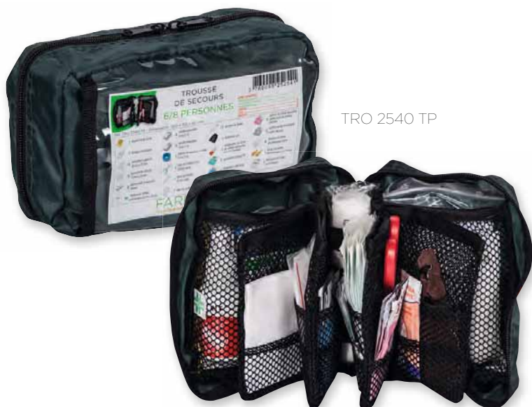
TRO 2540 TP