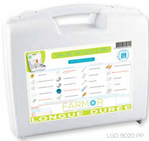
LGD 9020 PP