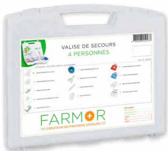
VAL 2470 PP