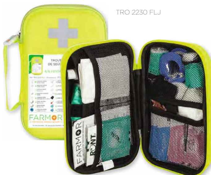
TRO 2230 FLJ