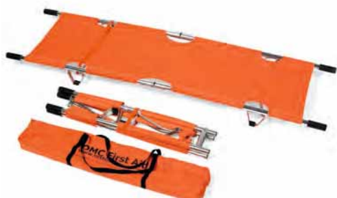
URGENCE & ACCESSOIRES