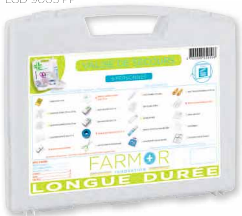
LGD 9005 PP

*Par rapport aux autres trousse de secours