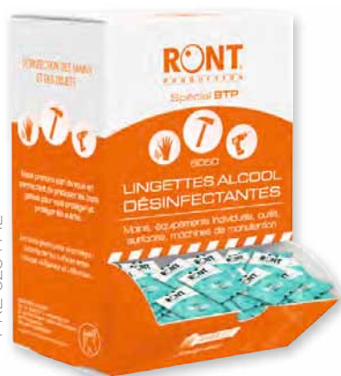
Distributeurs de lingettes imprégnées page 109