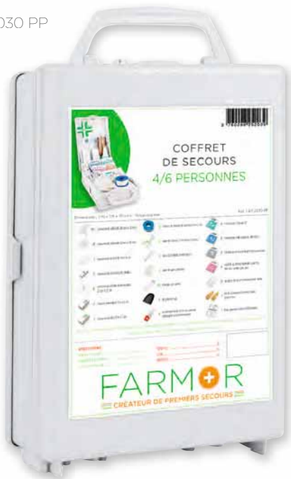
FAR 2030 PP

Fournis avec une signalétique 1 ers secours et son grippeur autocollant