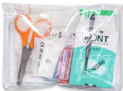
CRI 3030 TP