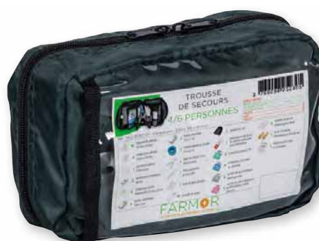
TRO 2030 TP

Tissu imperméable Légère et compacte, idéale en déplacement, ou en intervention Fermeture par zip & accroche ceinture Pochettes intérieures en filet pour une visibilité immédiate et un rangement hygiénique et ordonné des produits Dimensions : 200 x 150 x 80 mm – Poids : 385 g Livrée emballée