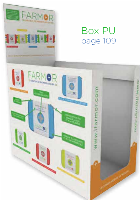
Box PU page 109