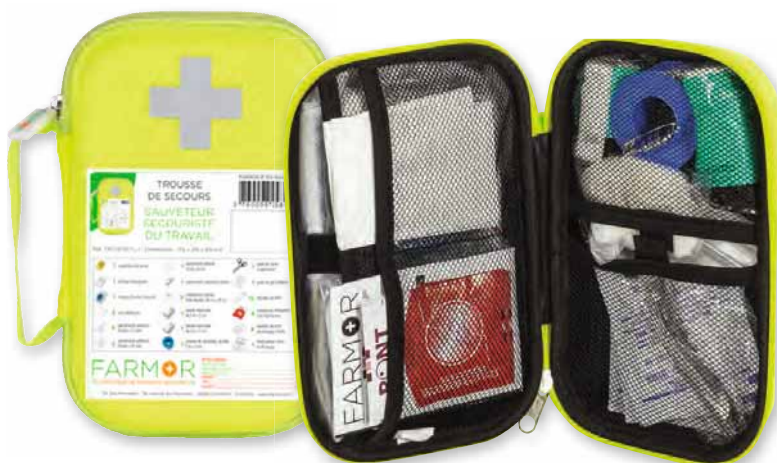
TRO 8130 FLJ