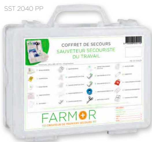
SST 2040 PP