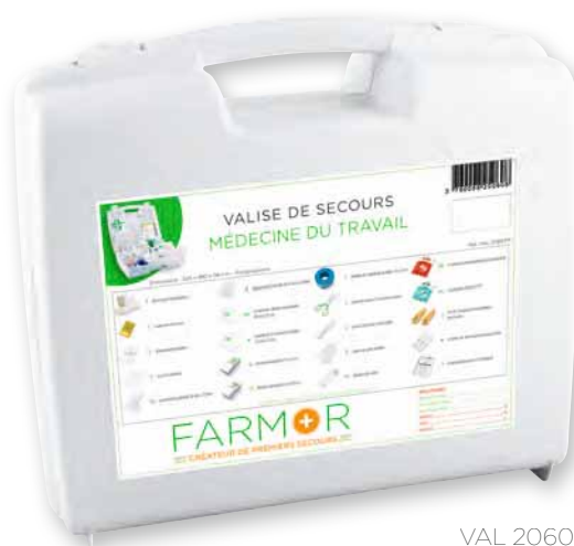
VAL 2060 PP