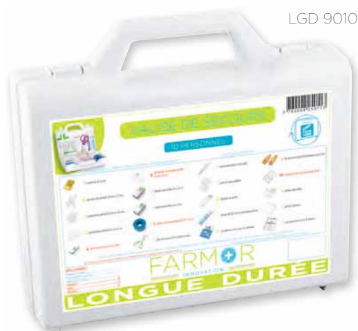
LGD 9010 PP