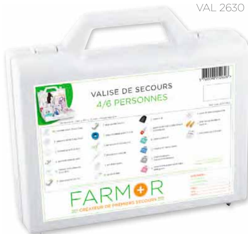
VAL 2630 MUL