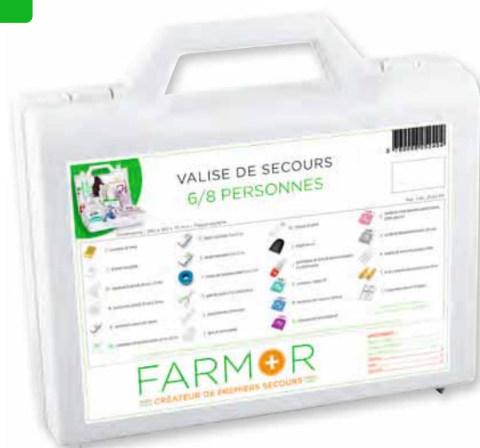
VAL 2040 PP