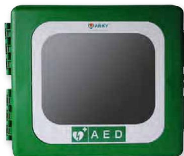
Armoire extérieure verte avec alarme page 13