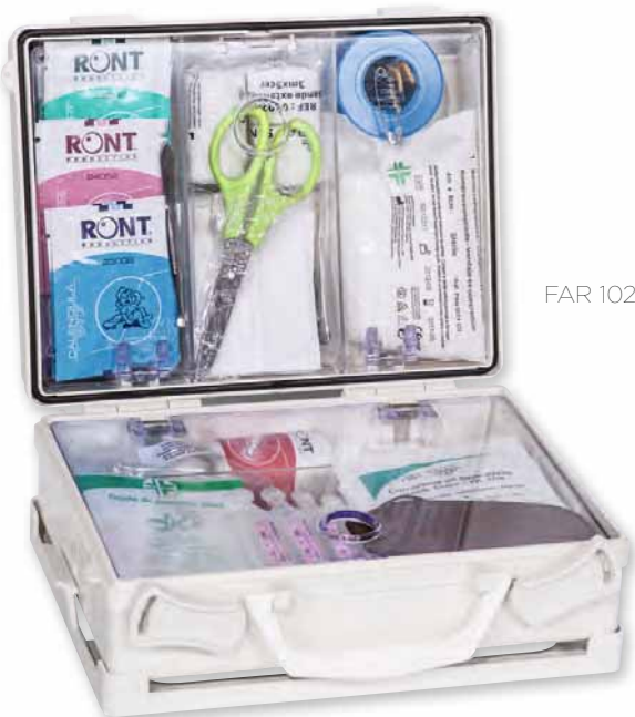
FAR 1020 AP