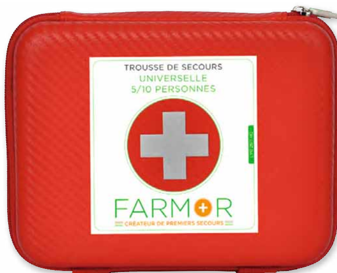
LYR 2517 RO