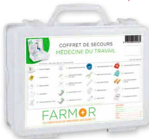
FAR 2060 PP