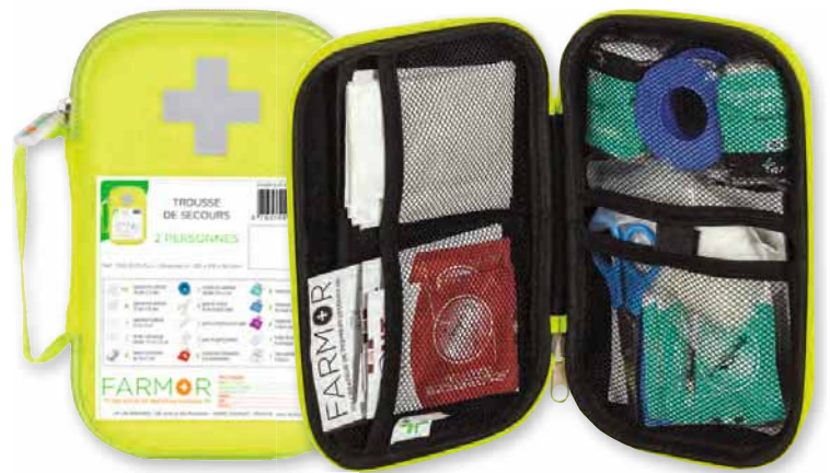
TRO 2770 FLJ

Cette trousse est disponible en box de 10 pièces Réf : BOX 2770 FLJ