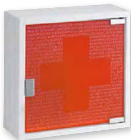
ARMOIRES & KITS