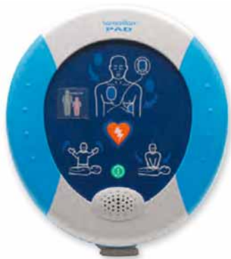
DEF 1001 SA

DEF 1001 SA : Défibrillateur SEMI-AUTOMATIQUE