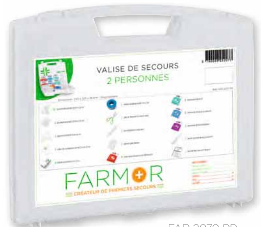
FAR 2070 PP

Cette valise est disponible en box distributeur de 10 pièces Réf : BOX 2070 BP