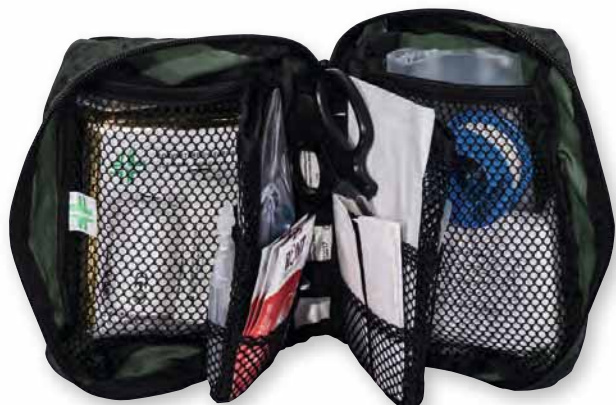
TRO 8030 TP

Cette trousse est disponible en box comptoir de 16 pièces Réf : BOX 8030 TP