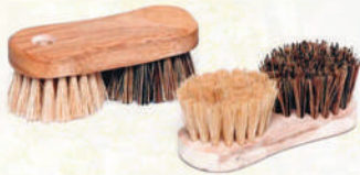
Brosse à légumes