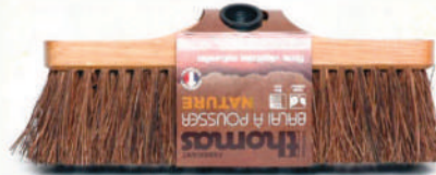
Balai à pousser