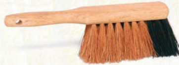
Balayette manche court