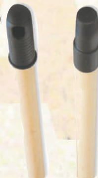
Balai pleine paille