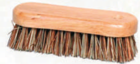
Brosse à mains