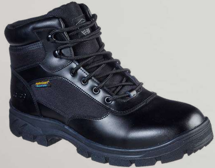
REF. SK77526EC WASCANA - BENEN WP