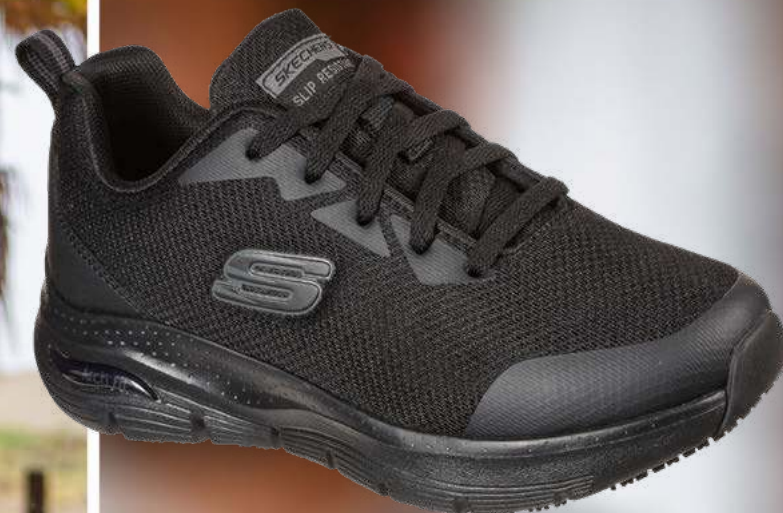
SK108019EC ARCH FIT SR