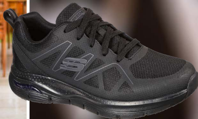
SK200025EC ARCH FIT SR - AXTELL