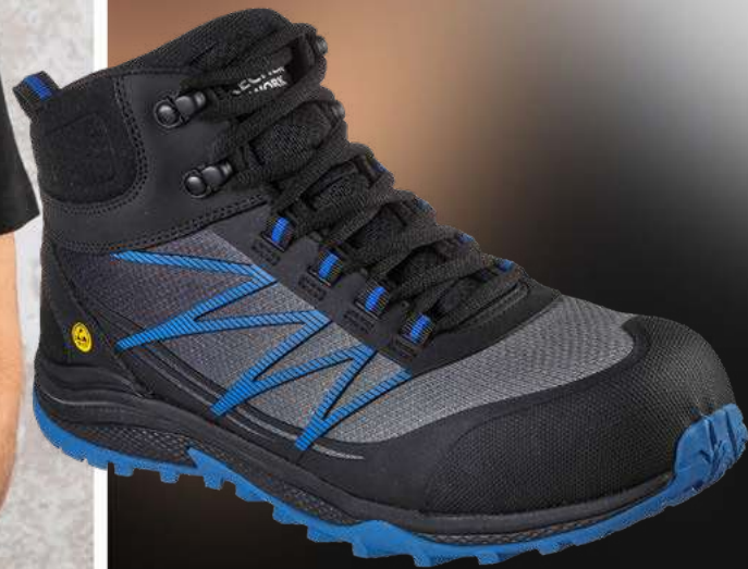
REF. 200047EC PUXAL FIRMLE