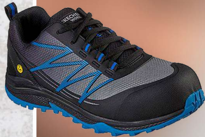
REF. SK200046EC PUXAL COMP TOE