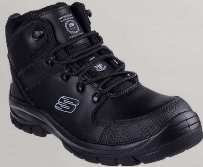
REF. SK200187EC TROPHUS - PENDING