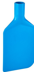
Raclette à cuve, 210 mm