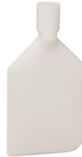
Raclette à cuve, 220 mm, Blanc