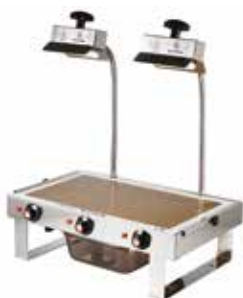
LAMPE À SUCRE DOUBLE 2X500 WATTS REF:262210