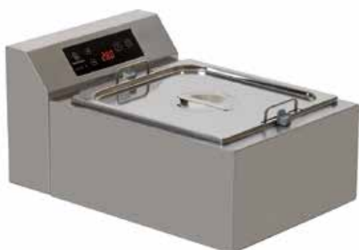
CHOCO 15 TREMPEUSE À EAU REF:260501