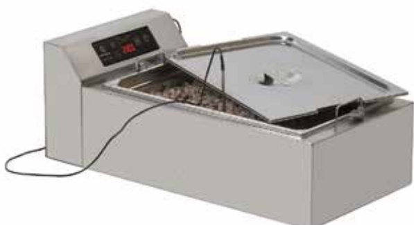
CHOCO 22 T TEMPÉREUSE À EAU REF:260522