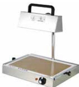
LAMPE À SUCRE 1000 WATTS REF:262201