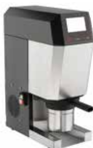
PRÉPARATEUR DE GLACES ET SORBETS EASY GIAZ REF:212520