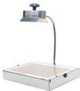
LAMPE À SUCRE 500 WATTS REF:262215