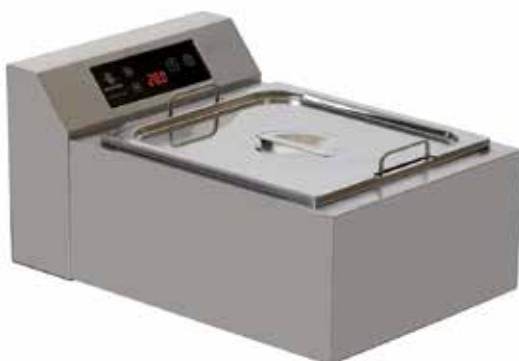
CHOCO 15 R TREMPEUSE À AIR REF:260510