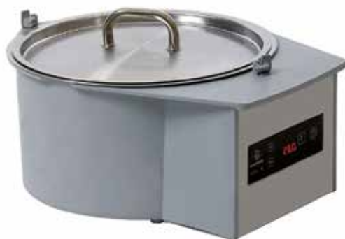
CHOCO 10 TREMPEUSE RONDE À EAU REF:260456