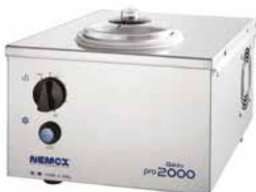
NEMOX SORBETIÈRE GELATO PRO 2000 REF:265220