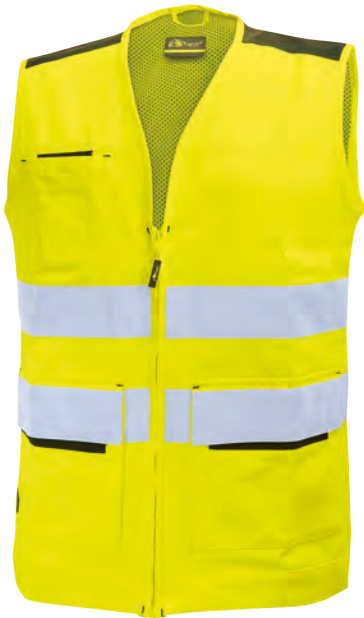
code HL153YF col. YELLOW FLUO