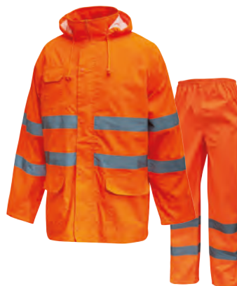
code HL168OF col. ORANGE FLUO