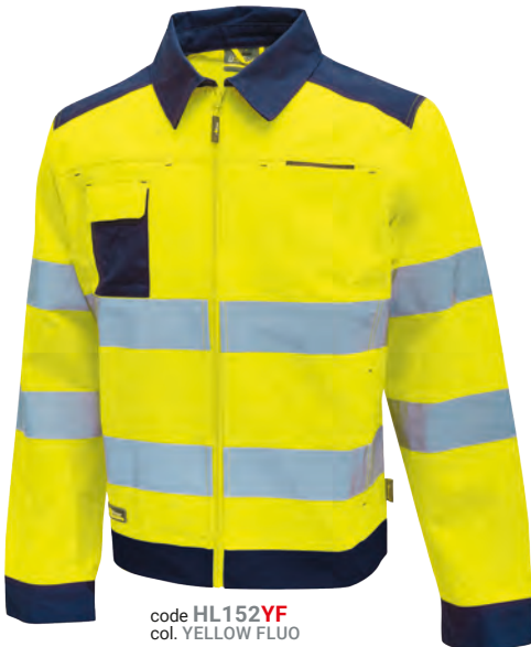
code HL152YF col. YELLOW FLUO