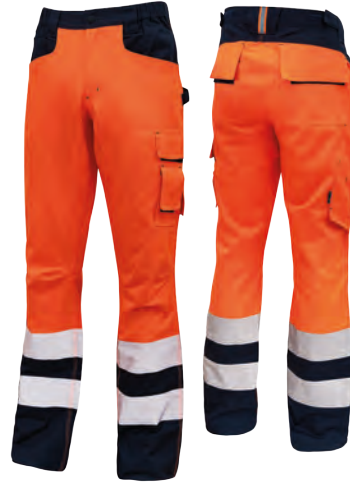
code HL155OF col. ORANGE FLUO