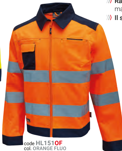
code HL151OF col. ORANGE FLUO