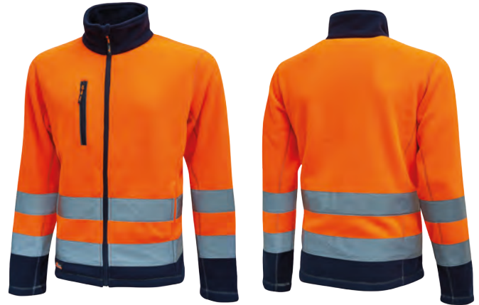
code HL207OF col. ORANGE FLUO