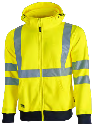
code HL180YF col. YELLOW FLUO