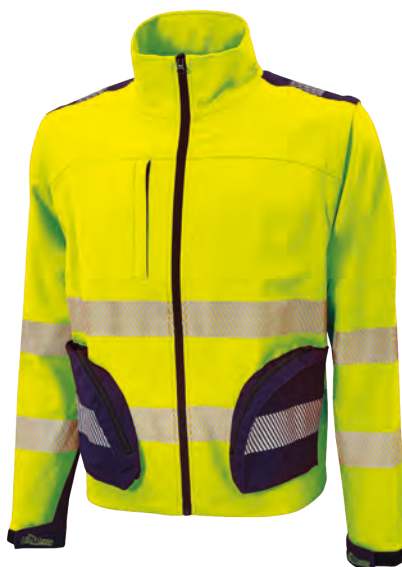
code HL223YF col. YELLOW FLUO