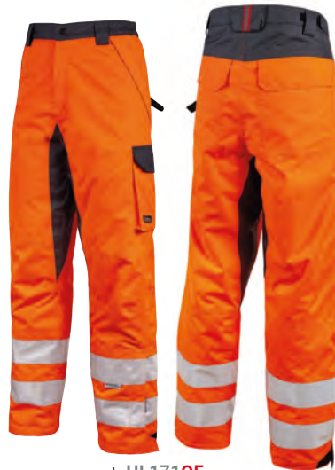
code HL171OF col. ORANGE FLUO

EN 342 EN 343 CE EN ISO 13688 EN ISO 20471