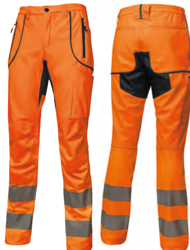
code HL186OF col. ORANGE FLUO