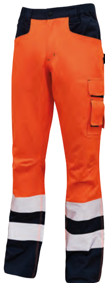
code HL157OF col. ORANGE FLUO