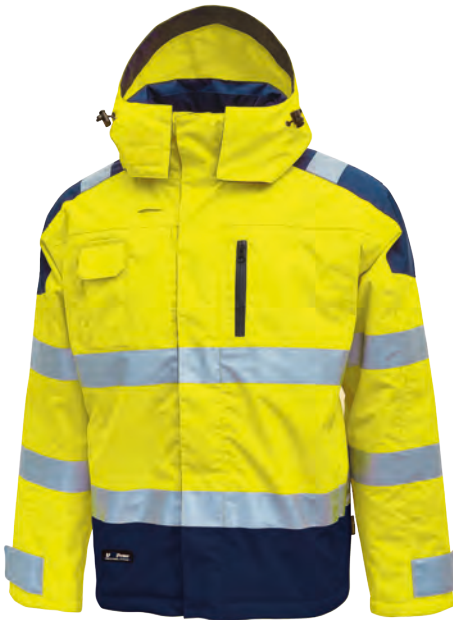
code HL161YF col. YELLOW FLUO