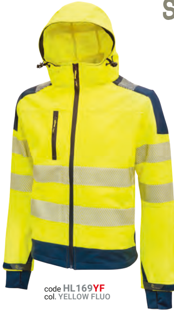
code HL169YF col. YELLOW FLUO