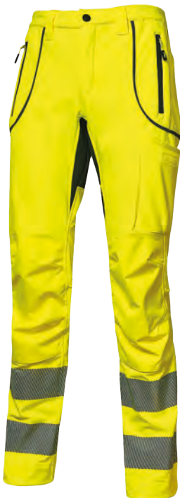
code HL186YF col. YELLOW FLUO