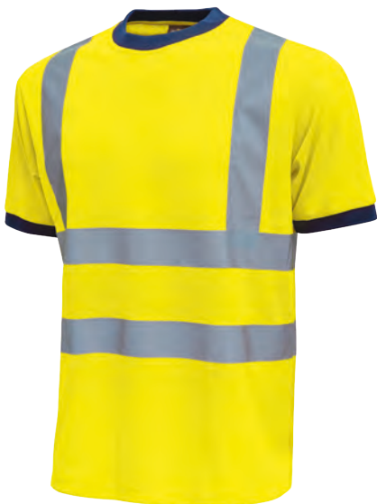
code HL197YF col. YELLOW FLUO