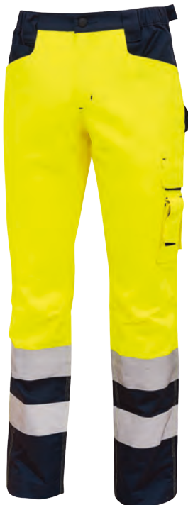
code HL156YF col. YELLOW FLUO