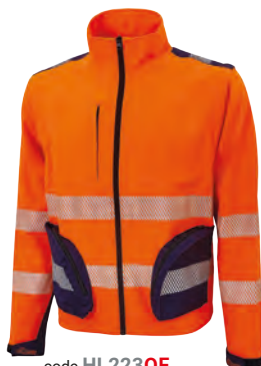
code HL223OF col. ORANGE FLUO