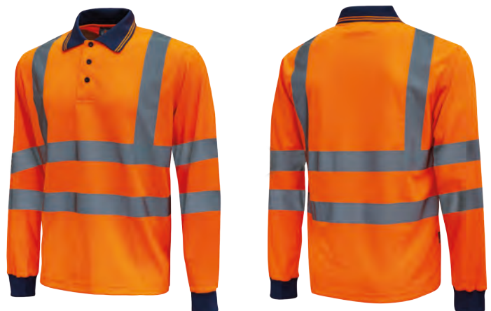
code HL199OF col. ORANGE FLUO