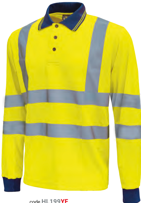
code HL199YF col. YELLOW FLUO