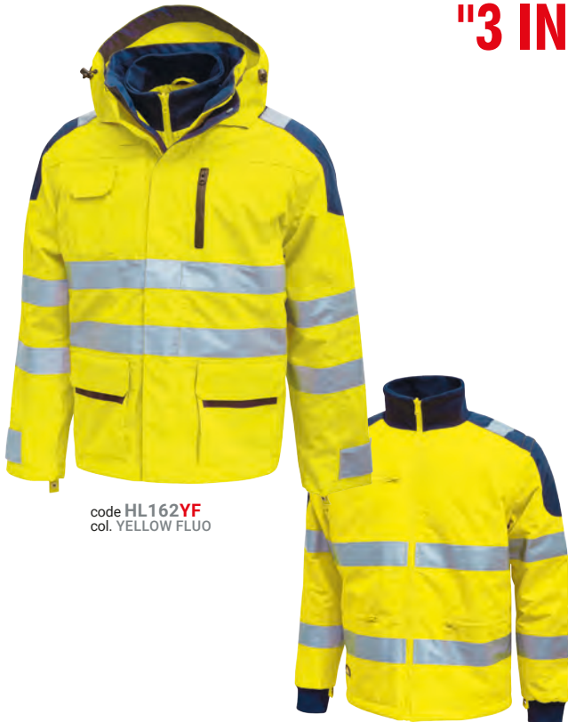
code HL162YF col. YELLOW FLUO