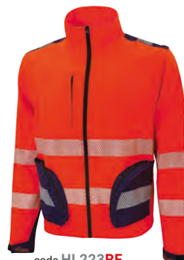
code HL223RF col. RED FLUO