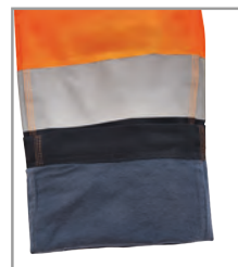
Intérieur en flanelle souple