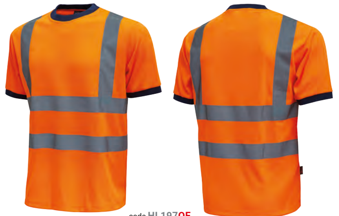
code HL197OF col. ORANGE FLUO