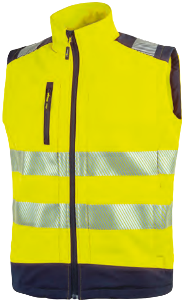
code HL173YF col. YELLOW FLUO