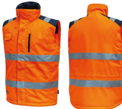
code HL159OF col. ORANGE FLUO