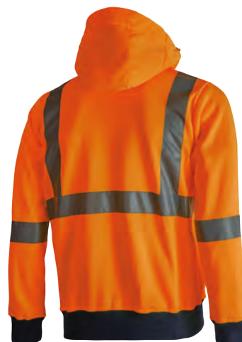
code HL180OF col. ORANGE FLUO