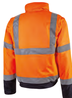
code HL158OF col. ORANGE FLUO