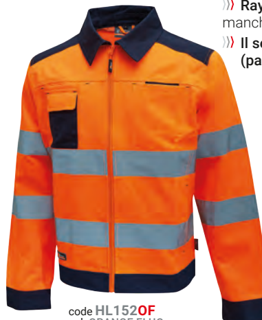
code HL152OF col. ORANGE FLUO