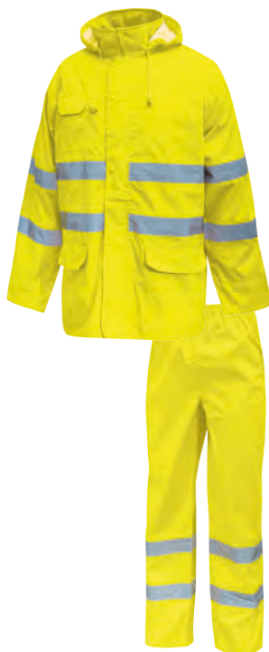
code HL168YF col. YELLOW FLUO