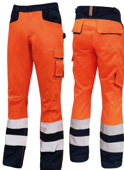
code HL156OF col. ORANGE FLUO