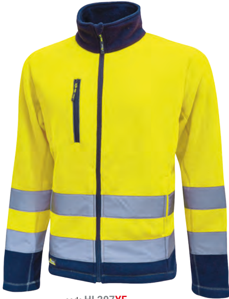
code HL207YF col. YELLOW FLUO