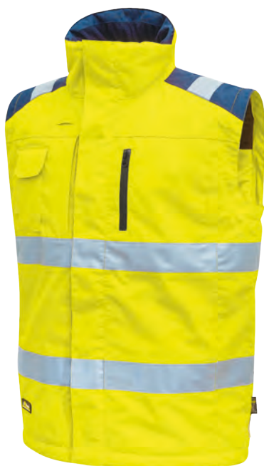
code HL159YF col. YELLOW FLUO