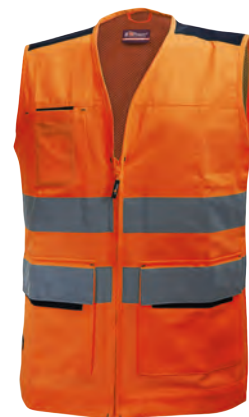
code HL153OF col. ORANGE FLUO