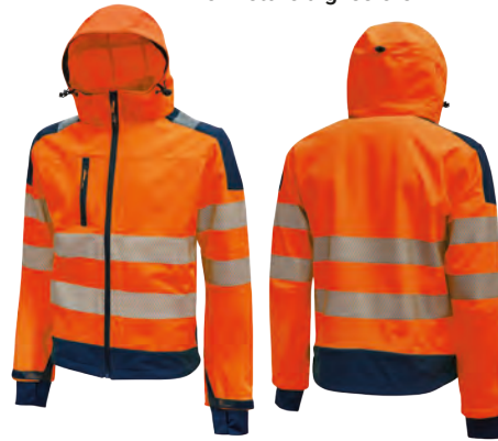
code HL169OF col. ORANGE FLUO