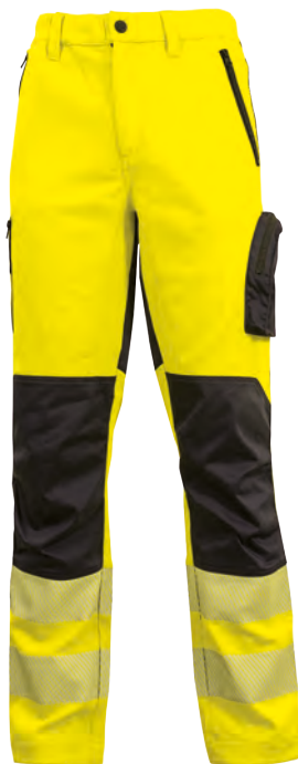
code HL222YF col. ORANGE FLUO