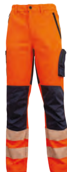
code HL222OF col. ORANGE FLUO

Taille élastique et bouton anti-rayures.