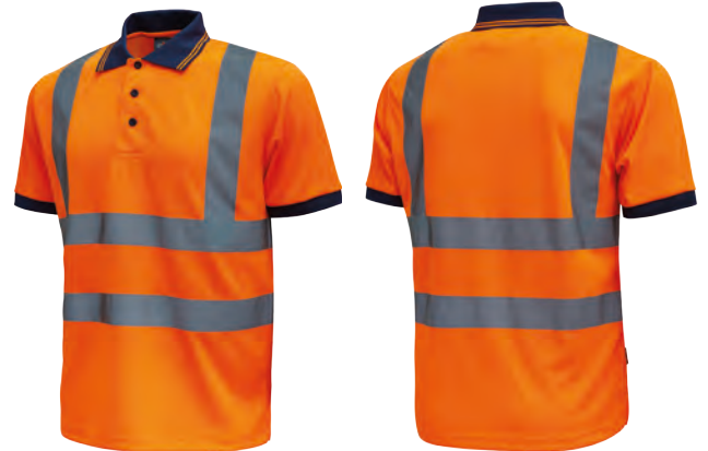
code HL198OF col. ORANGE FLUO