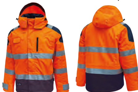
code HL161OF col. ORANGE FLUO

EN 14058 EN 343 CE EN ISO 13688 EN ISO 20471