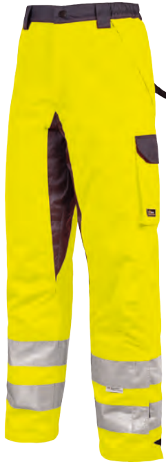
code HL171YF col. YELLOW FLUO