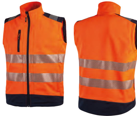
code HL173OF col. ORANGE FLUO