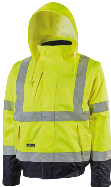
code HL158YF col. YELLOW FLUO

EN 14058 EN 343 CE EN ISO 13688 EN ISO 20471