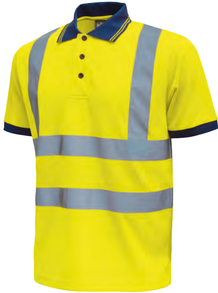
code HL198YF col. YELLOW FLUO