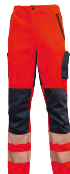
code HL222RF col. RED FLUO