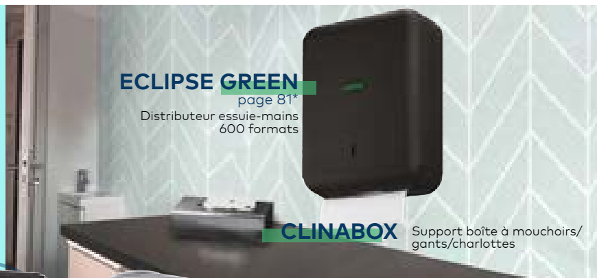
ECLIPSE GREEN page 81*

Distributeur essuie-mains à dévidage central 450 formats