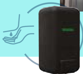
ECLIPSE GREEN page 81*

Support boîte à mouchoirs/gants/charlottes