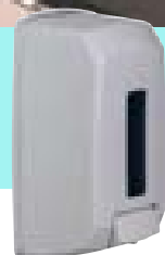
SANEVA page 78*