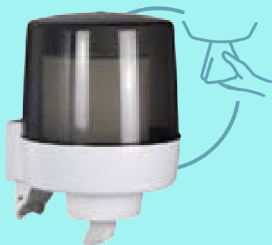
ROLLADO page 83*

Distributeur essuie-mains à dévidage central 450 formats