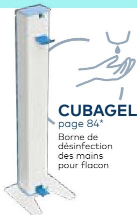
CUBAGEL page 84*

Borne de désinfection des mains pour flacon