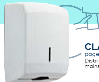
CLARA page 82*