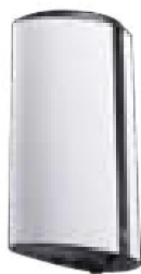
LENSEA page 80*

Borne de désinfection des mains pour flacon