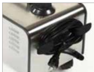
STRUCTURE EN ACIER INOXYDABLE