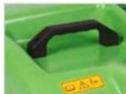
Poignée pour un transport facile