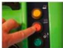
Tableau de commande électromécanique avec protection contre l'humidité