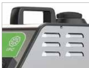
POIGNÉE POUR UN TRANSPORT PRATIQUE