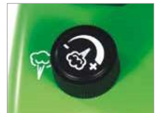
BOUTON DE CONTRÔLE POUR RÉGULER LA SORTIE DE LA VAPEUR