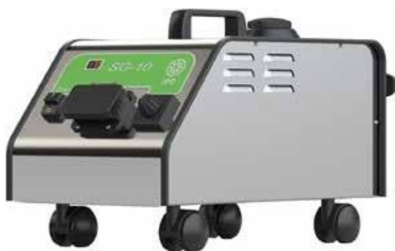
CHAUDIÈRE AVEC RÉSERVOIR DE REMPLISSAGE AUTOMATIQUE