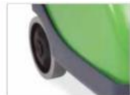
Roue non marquante