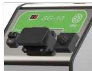
INDICATEUR NUMÉRIQUE DE : TEMPÉRATURE DE LA CHAUDIÈRE PRÊT À LA VAPEUR MANQUE D'EAU