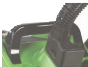
POIGNÉE POUR TRANSPORT FACILE