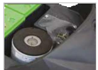
MOTEUR D'ASPIRATION 3 ÉTAGES