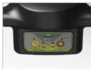
PROGRAMMES DE TRAVAIL PRÉDÉFINIS