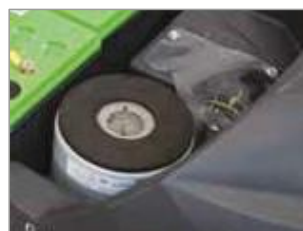
MOTEUR D'ASPIRATION 3 ÉTAGES