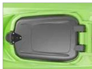
NOUVEAU GRAND CAPOT