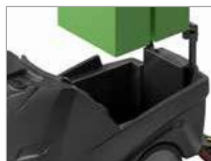
EMPLACEMENT LARGE POUR LA BATTERIE