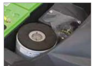
MOTEUR D'ASPIRATION 3 ÉTAGES