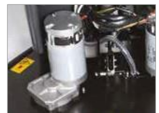
MOTEUR DE HAUTE QUALITÉ RÉDUITÉ