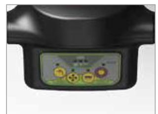
PROGRAMMES DE TRAVAIL PRÉDÉFINIS