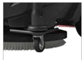
ROUE DE TRANSPORT BREVETÉE