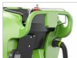
NOUVELLE POIGNÉE ERGONOMIQUE