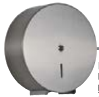
→ AXOS page 78* Distributeur de papier hygiénique 200M et 400M