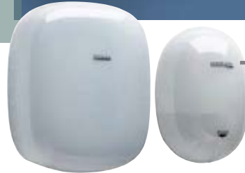
→ KOSTEA page 82* Distributeurs robustes savon 0,85L et essuie-mains 600 feuilles