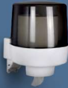
ROLLADO page 83* Distributeur essuie-mains à dévidage central 450 formats