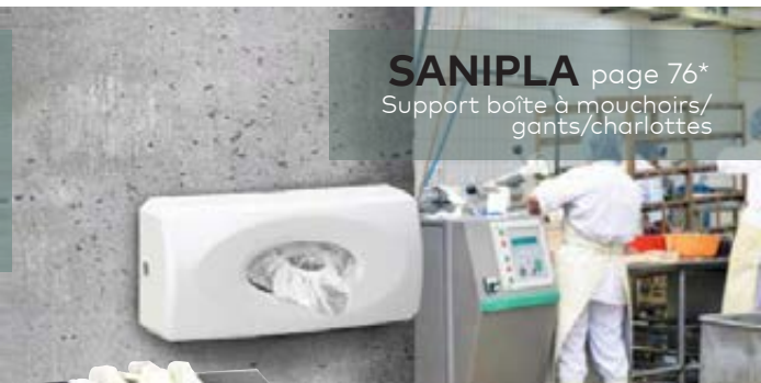
→ CLINABOX page 76* Support boîte à mouchoirs/gants/charlottes