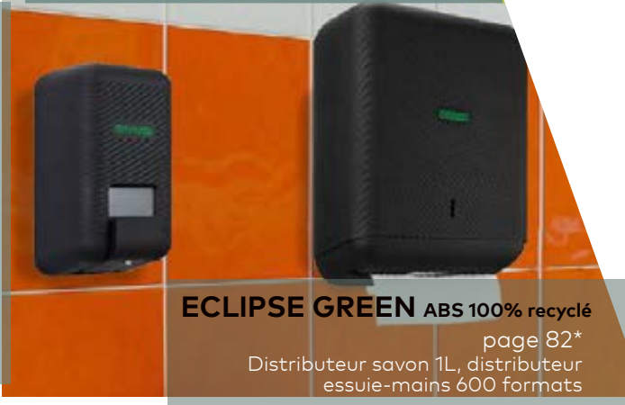
ECLIPSE GREEN ABS 100% recyclé page 82* Distributeur savon 1L, distributeur essuie-mains 600 formats