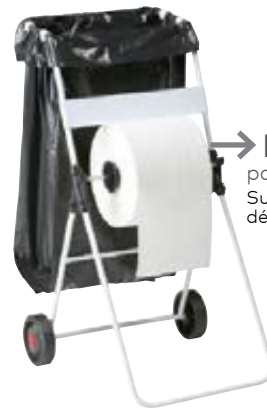
→ BOBINO page 83* Support sac mobile avec dérouleur bobine papier