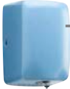
→ ZEFF page 94* Sèche-mains automatique horizontal 1150W