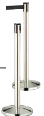
← PACEO page 66* Lot de 2 barrières de délimitation