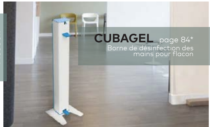
CUBAGEL page 84* Borne de désinfection des mains pour flacon