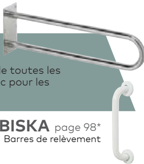
BISKA page 98* Barres de relèvement