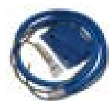
Kit outil de surface (tuyau et outil)