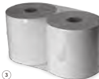
ESSUIE-MAINS 450 ECO